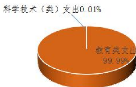
图5：财政拨款支出决算结构（按功能分类）

2019 年度财政拨款支出 4586.12 万元，主要用于以下方面：教育（类）支出 4585.82 万元，占 99.99%；科学技术（类）支出 0.3 万元，占 0.01%。